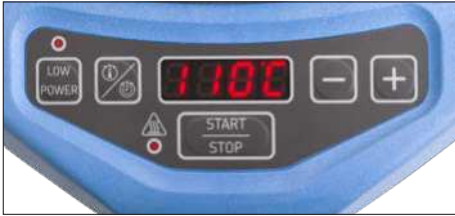
Fig. 2: Interfaz de usuario