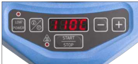
Fig. 2 – Brugergrenseflade