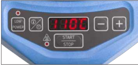
图 2 - 用户界面