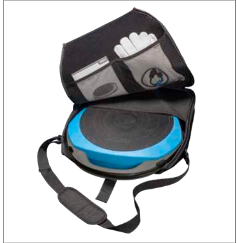
Fig. 3 & 4 – Carrying and storage bag for TWIM 15