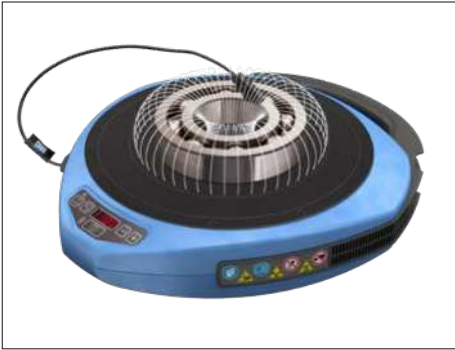
Fig. 1 – Campo magnético ao redor do rolamento

O aquecedor por indução portátil TWIM 15 consiste em uma placa de polímero reforçado com fibra de vidro, resistente a altas temperaturas, e bobinas eletromagnéticas, situadas abaixo da placa. Quando o aquecedor está ligado, uma corrente elétrica passa pelas bobinas e gera um campo magnético oscilante, que não aquece a placa superior em si. Porém, assim que um componente de ferro ou aço inoxidável é colocado sobre a placa, o campo magnético induz muitas correntes elétricas pequenas (correntes parasitas) no metal dos componentes.